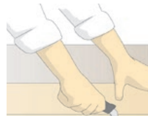
Tål 12 mån exponering !