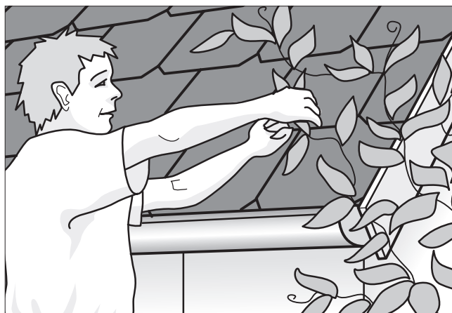
Fjern vildtvoksende planter fra tagrender og tag.