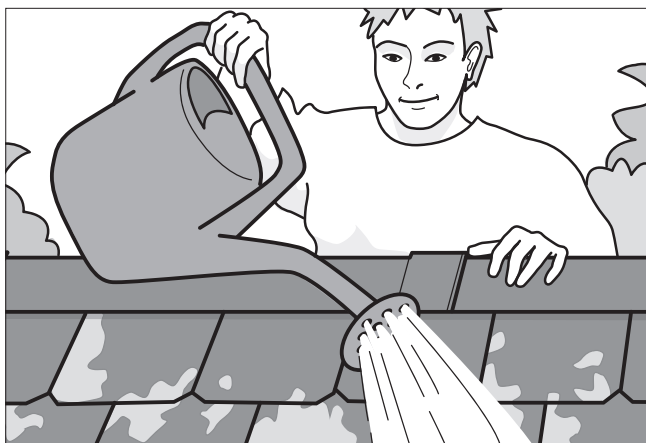
Fjern mos- og algevækst og overbrus med et middel mod grønne belægninger.