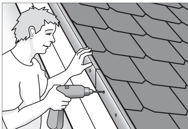
Fastgør løse inddækninger.

Vær opmærksom på fygesne efter snestorm.