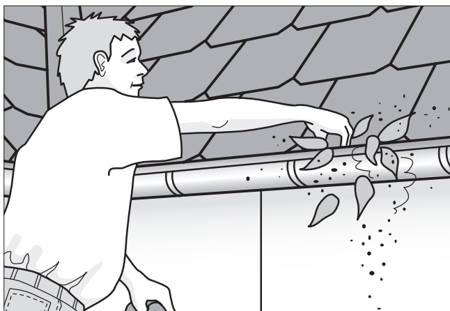
Rens tagrender og skotrender for snavs og blade.