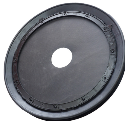
Undertagskrave til Swisspearl Hætte til faldstamme