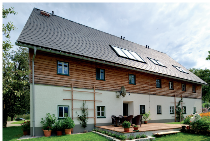
Wohnhaus vor und nach der Sanierung mit der Eternit Dachplatte ED RE 40/60