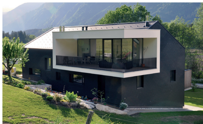
Wohnhaus vor und nach der Sanierung mit der Eternit Dachplatte DD Rechteck 40/30 vollkantig Architektur und Fotografie: DI Stefan Thalmann