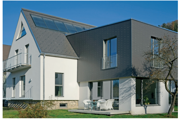
Wohnhaus vor und nach der Sanierung mit der Eternit Dachplatte RE DD 60/40 Architektur: Röthl Architektur ZT GmbH