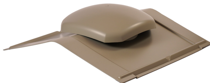
Hætte til montage mellem vinkelrygninger