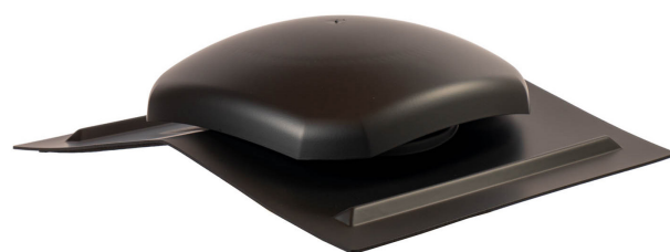
Hætte til montage ovenpå vinkelrygninger