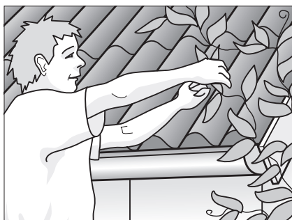
Fjern vildtvoksende planter fra tagrender og tag.