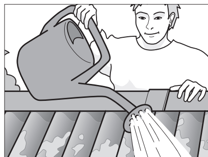
Fjern mos- og algevækst og overbrus med et middel mod grønne belægninger.