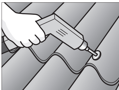
Fastgør løse skruer.