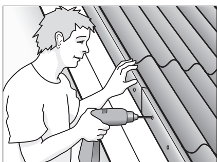
Fastgør løse inddækninger.