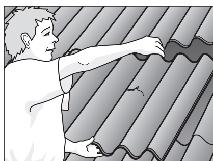
Udskift knækkede eller revnede plader.

Vær opmærksom på fygesne efter snestorm.