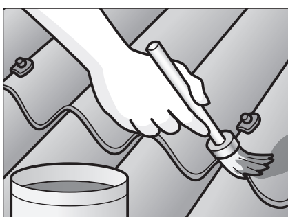
Pletmal småskader i farvelaget.