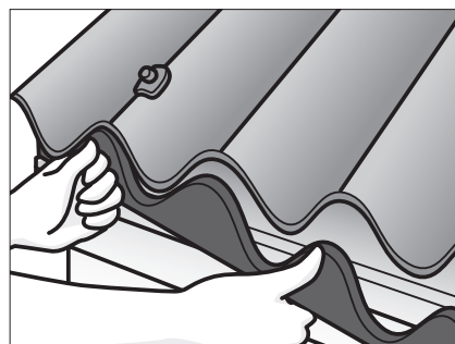
Bring plast bølgeklodser på plads, og rens tilstoppede ventilationsåbninger/hætter.